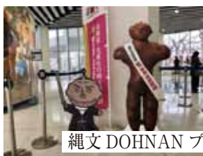
縄文 DOHNAN プロジェクト HP より